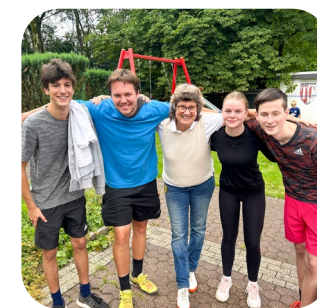
Trainerteam & Helfer

Weitere Informationen unter www.tennisschule-vollmann.de